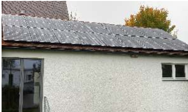
Neue Anlage auf dem Dach des Gemeindehauses