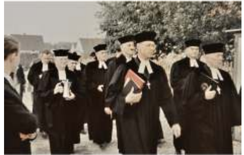
Einweihung 25.09.1960 - Festzug

Vor dem Gotteshaus hatten sich zahlreiche Gemeindemitglieder und viele weitere Neustädter Bürger eingefunden, als sich der Festzug näherte.