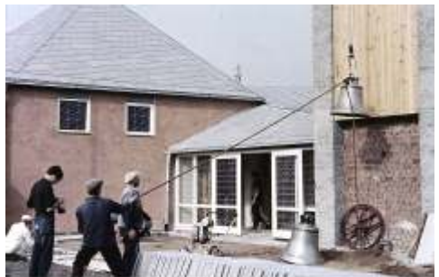
Aufziehen der Christusglocke und Lutherglocke

Der Bau schritt rasch voran und so konnte bereits am 22. April 1960 das Richtfest gefeiert werden.