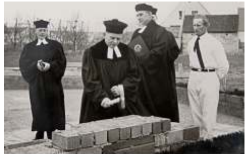
Grundsteinlegung Christuskirche 31.10.1959