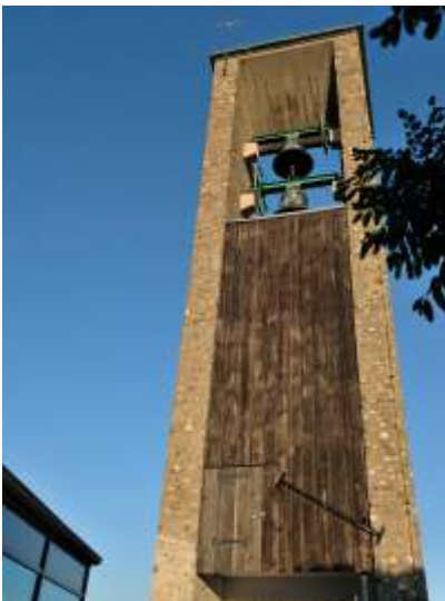
Neue Tür im Glockenturm Neustadt

Herr Ertlmeier: "Sieht jetzt wieder aus wie gleich nach Neubau-Fertigstellung".