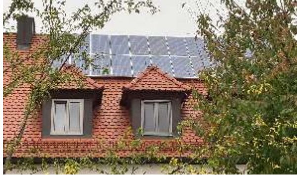
Alte Anlage auf dem Dach des Pfarrhauses

Somit unterstützt unsere Kirchengemeinde die Gewinnung von Strom aus erneuerbaren Energien.