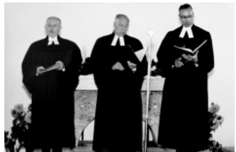
Einweihung - Festgottesdienst