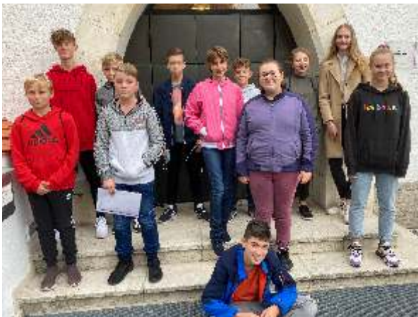
Im Bild 12 der insgesamt 15 neuen Konfis in Abensberg

Wir freuen uns, dass trotz Corona-Einschränkungen am Freitag, 2. Okt. endlich unser neuer Konfiksurs starten konnte.