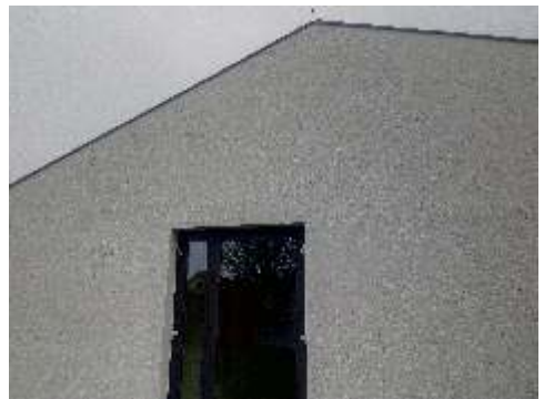
Fotos: Westgiebel Gemeindezentrum IRENE